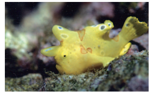
こちらが噂のカエルアンコウ！