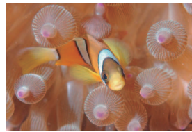
可愛い熱帯魚にも出会えます！