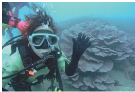
オオスリバチサンゴの前で