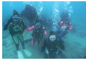
一緒に潜ったみなさんと